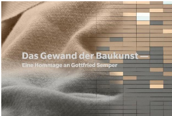
Fassadensysteme von wienerberger