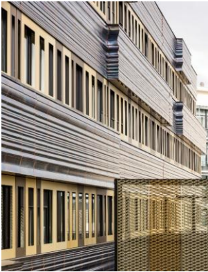
Vorgehängte hinterlüftete Fassade, Produktlinie Argeton: individuelle Sonderanfertigung