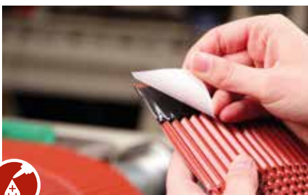
3fach erhöhte Klebhaftung