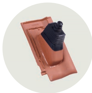
Antennen System Ø 40-60 mm Ton