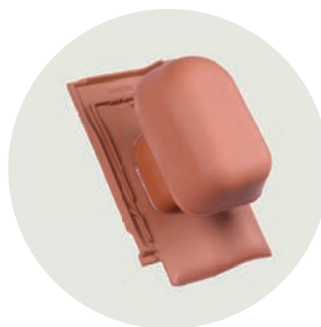
Dunstrohr- & Dachlüfter System Ø 125/160/200 mm Ton