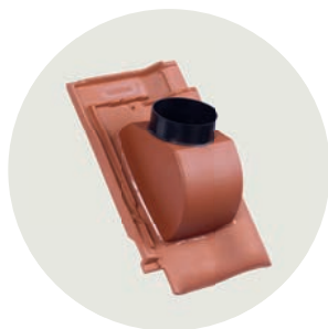
Thermen System Ø 110/125 mm Ton

Unsere vollkeramischen Durchgangsziegel und Dunstrohre sind in vielen Formen und Farben erhältlich. Sie sind einbaufertig und ermöglichen eine einfache, sichere Montage. So bleibt Ihr Dach dauerhaft dicht und zuverlässig vor Wasser geschützt.