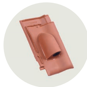
Solar System Ø ca. 70 mm Ton