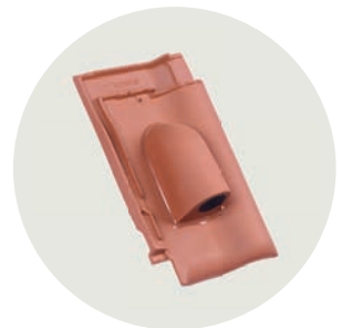
Solar System Ø ca. 70 mm Ton