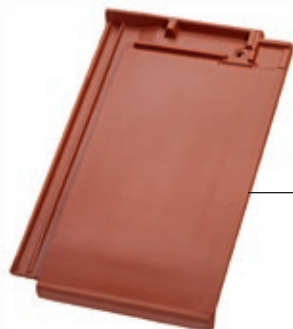
Plano 11 Schwarz