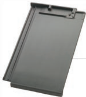
Plano 11 Edelanthrazit