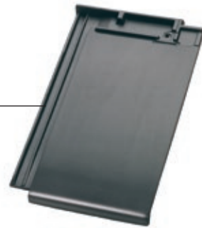
Plano 11 Schiefergrau